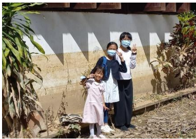
この高さまで泥水が押し寄せました

タイは一年の半分は雨の季節、半分は雨が降らない乾いた季節です。雨の季節の終わりには、毎年のように洪水があります。でも昨年のチェンマイの洪水はいつもとは違う大きな洪水でした。チェンマイの日本語教会にも泥水が押し寄せました。集まって礼拝するためには大掃除が必要でしたが、タイの教会の人たちが夜遅くまで手伝ってくれました。自分たちの家も大掃除が必要なのに、「教会を先にしましょう！」と助けてくれたのです。日本の教会からもお祈りと献金が届きました。