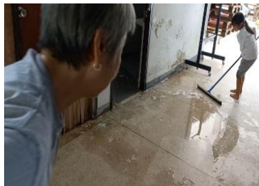
子どもも大人も一緒に大掃除