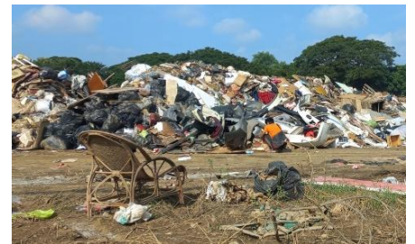
皆さんの大切なものの多くがゴミに...

洪水の後には泥で使えなくなってしまった物がゴミになって山のように積まれます。私たちは掃除をしながら、「なくなる宝を天国に持っている安心と希望（マタイ6：20）を、まだ知らない人たちに届けたいですね」と話し合いました。大切なものを失って悲しんでいる人が今も世界中にいます。どんな大水にも押し流されない神さまの愛（雅歌8：7）を届ける人を神さまは今日も捜し求めておられます。