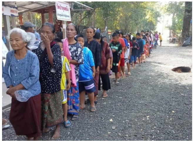
配給に並ぶ避難民